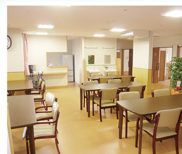
明るい食堂で楽しく食事♪