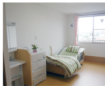
24時間のナースコール対応!