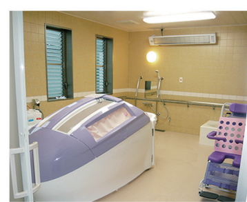
安心して入浴できるミスト浴完備!