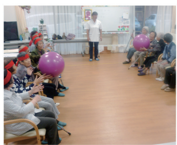
デイサービス併設で活動的な毎日!